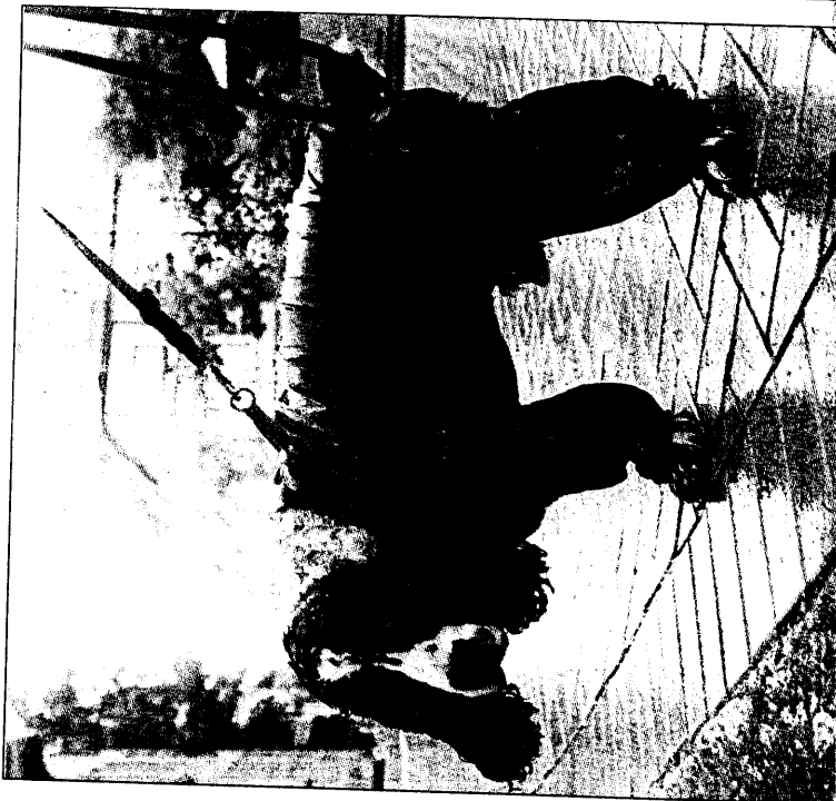
■ Liten, søt ... og våt på ørene

Samsnylvis er årets sesong tidens dårligste besøkte for sjøbadet. Det oppvarmede utendørsbassenget stod klart til 65-sesongen, og virket som en magnet for badelystne bergensere og tilreisende. Sjøbadet åpnet 18. mai i september stenges portene for sesongen, og ingenting tvder