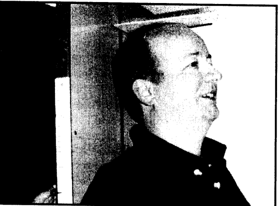
Alt skal være på plass, også Ellingsens høyde.