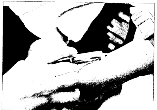
To blodprøver vert tekne.